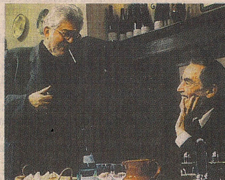
Grandi Ettore Scola sul set del suo film «La cena» con uno dei protagonisti, Vittorio Gassman

«La Cinegustologia - spiega Lombardi - è un nuovo approccio che, estrapolando profumi, sapori e sensazioni tattili dalla filmografia di vari registi, proprio come se le loro opere fossero cose da bere o da mangiare, permette di descrivere i vini e i cibi al di là dei linguaggi e dei rituali canonici della critica». A quasi dieci anni dalla nascita,